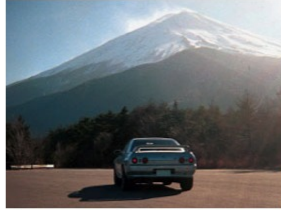
新車中古車購入時の割引

三河日産自動車の社員は社員割引購入制度が利用できます。なんとこの社員割引は2親等の家族まで利用が可能です。2親等とは、本人または配偶者から数えて2世代のこと、つまり社員または配偶者の両親や祖父母、兄弟が社員割引で車を購入できます。