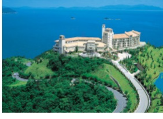
グランドエクシブ鳴門