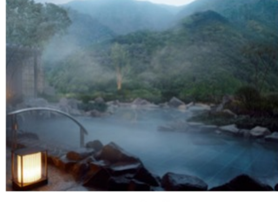
エクシブ箱根離宮

リゾートトラストと東急ハーヴェストクラブの会員なので全国の会員制高級リゾートホテルに格安で宿泊できます。