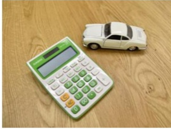
クレジット金利の優遇