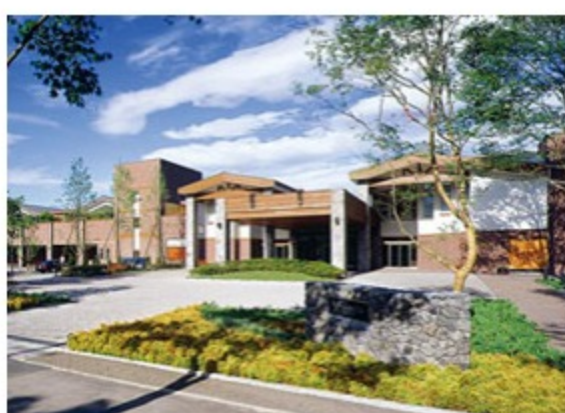
旧軽井沢アネックス