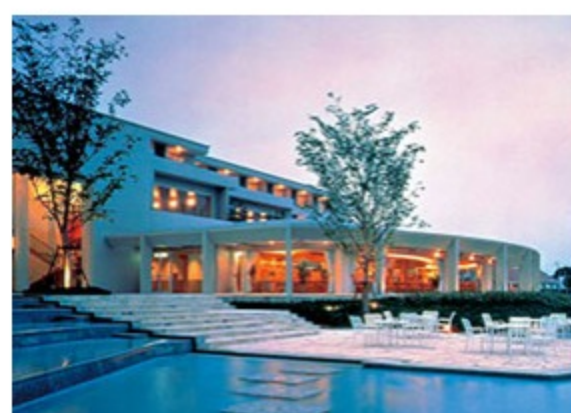
東急リゾートタウン浜名湖