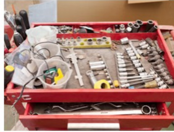
整備及び修理代の割引