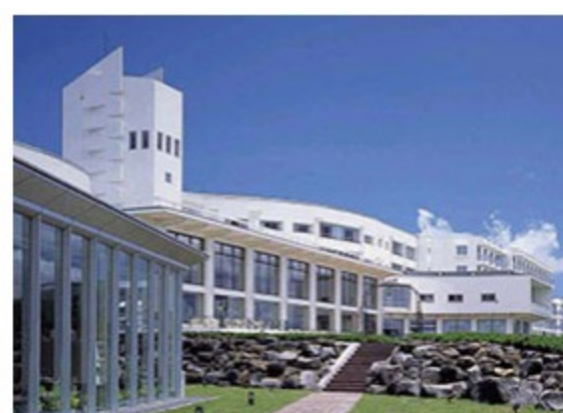
山中湖マウント富士