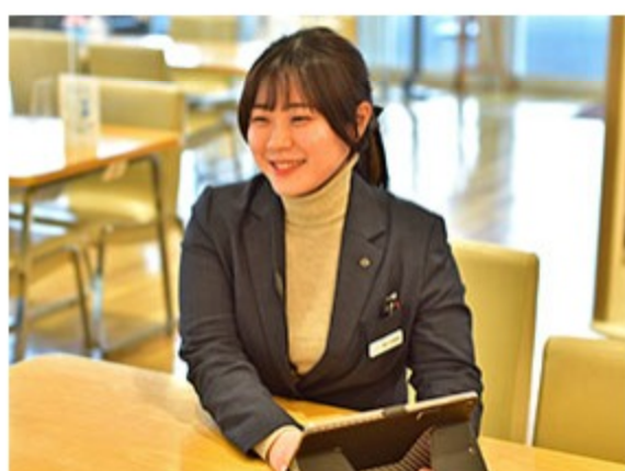
男女関係ないチャレンジ機会