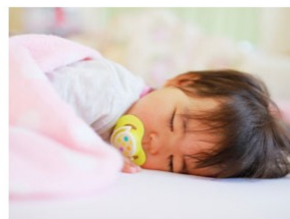
産休・育休を取りやすい雰囲気

”自動車業界は男社会”の時代は終わりました。今は女性が活躍できる会社でなければ生き残ることが出来ないと三河日産自動車は考えています。三河日産自動車では、男女問わず同じチャレンジの機会を与えていますので、営業職でも活躍している先輩が多く働いています。