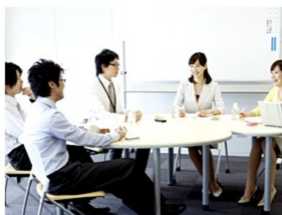
意見の言いやすい環境